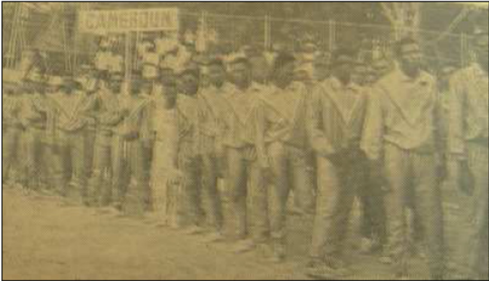
La délégation du Cameroun. Bingo , décembre 1961, n° 107, p. 36.