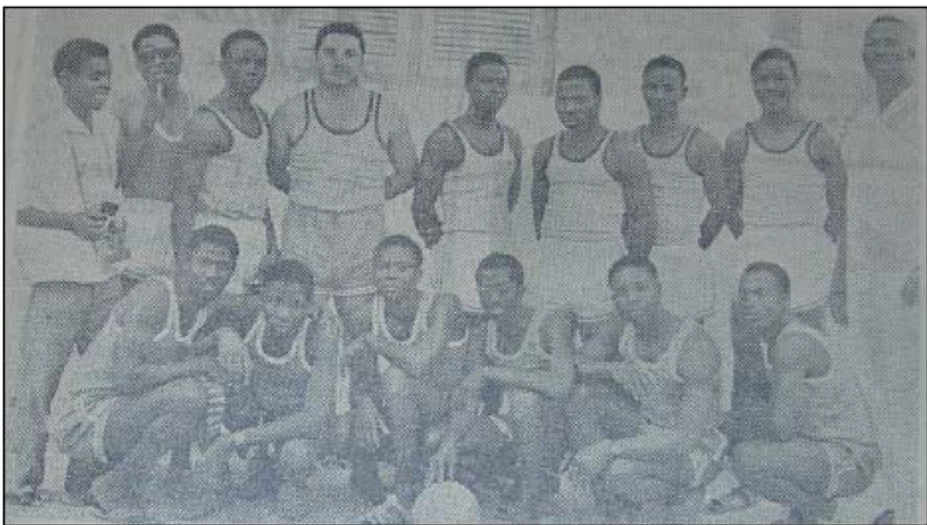
Joueurs de Zénoula, Cameroun, invités lors de la fête de l'indépendance du Sénégal, Bingo , février 1961, n° 97, p. 57 (Archives ANS).