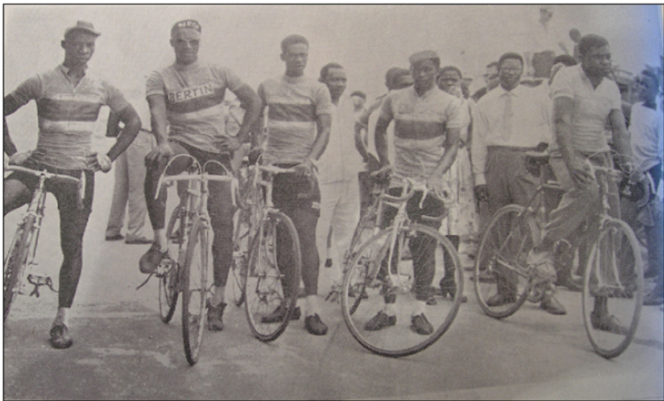
L'équipe nationale de cyclisme du Cameroun, Almanach du sport ivoirien , 2 ème édition, 1961, p. 50 (Archives ANS).