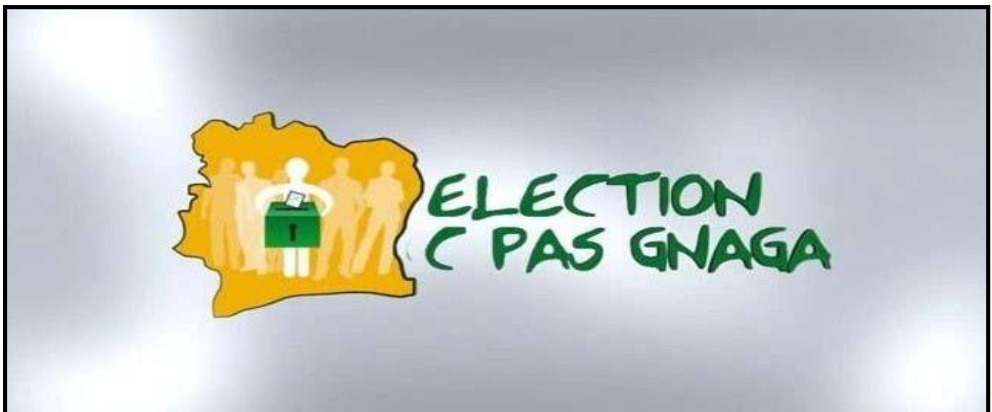
Image 3. Publicité servant de campagne pour les élections présidentielles de 2015

Toujours dans le même cadre des élections, le nouchi est utilisé pour véhiculer un message à la population ivoirienne dominée majoritairement par des jeunes. Ainsi, pour l'élection présidentielle d'octobre 2015, une campagne publicitaire a invité certaines stars ivoiriennes du sport à sensibiliser la population en cette phrase : « élection c pas gnaga » juste pour dire qu'une « élection ce n'est pas de la bagarre » (Voir l'image 3 ci-après).