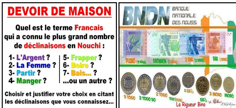
Images 4. Le nouchi sur les réseaux sociaux

Aujourd'hui, le nouchi occupe une place très importante sur les réseaux sociaux. Les internautes ivoiriens, entre un réel désir de fidélité à la culture ivoirienne et une non moins ardente envie d'épouser totalement et absolument cette nouvelle identité linguistique, donnent des cours en nouchi sur Facebook, Twitter, Instagram, etc. Ces deux images ci-dessous tirées des réseaux sociaux le démontrent.