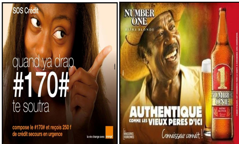
Images 1. Exemple d'affiches publicitaires

En ce qui concerne la presse écrite avec les journaux d'informations générales et la communication politique, le nouchi occupe une place importante. Ces deux exemples tirés des Unes de journaux le démontrent à travers les images 2. Pour le quotidien Nord-Sud , sa publication N° 1286 du 31 août 2009 retranscrit un discours du Président du Parti Démocratique de Côte d'Ivoire (PDCI), s'adressant à ses militants en nouchi en ces termes : « Plus de flôkô, les Refondateurs vont fraya », propos qui pourrait être traduits par « Il n'y aura plus de mensonges [dans la gestion de l'État], le régime des Refondateurs [le Front Populaire Ivoirien de Laurent Gbagbo au pouvoir de 2000 à 2011] va fuir (débarrasser le plancher) ». Quant au quotidien L'Intelligent d'Abidjan dans sa parution N° 2382 du 4 novembre 2011, parlant des élections législatives de 2011, barre sa Une par l'information suivante : NON à des élections koutcha et wouya-wouya . « Koutcha » et « wouya-wouya » sont deux termes malinké qui se traduisent respectivement par « truquées » et « chose sans importance » comme pour dire : « NON à des élections truquées et sans importance ».