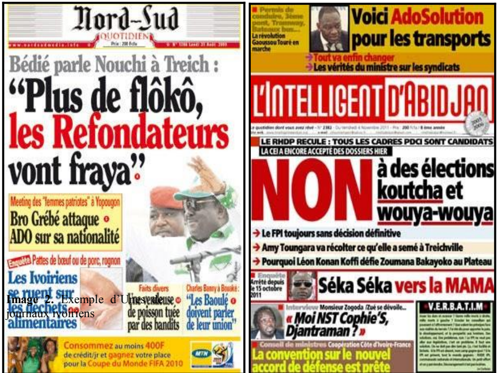
Image 2. Exemple d'Unes de journaux ivoiriens

Toujours dans le même cadre des élections, le nouchi est utilisé pour véhiculer un message à la population ivoirienne dominée majoritairement par des jeunes. Ainsi, pour l'élection présidentielle d'octobre 2015, une campagne publicitaire a invité certaines stars ivoiriennes du sport à sensibiliser la population en cette phrase : « élection c pas gnaga » juste pour dire qu'une « élection ce n'est pas de la bagarre » (Voir l'image 3 ci-après).